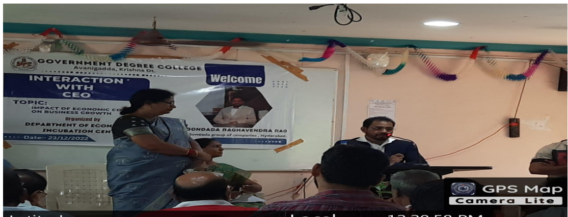
Opening remarks by principal